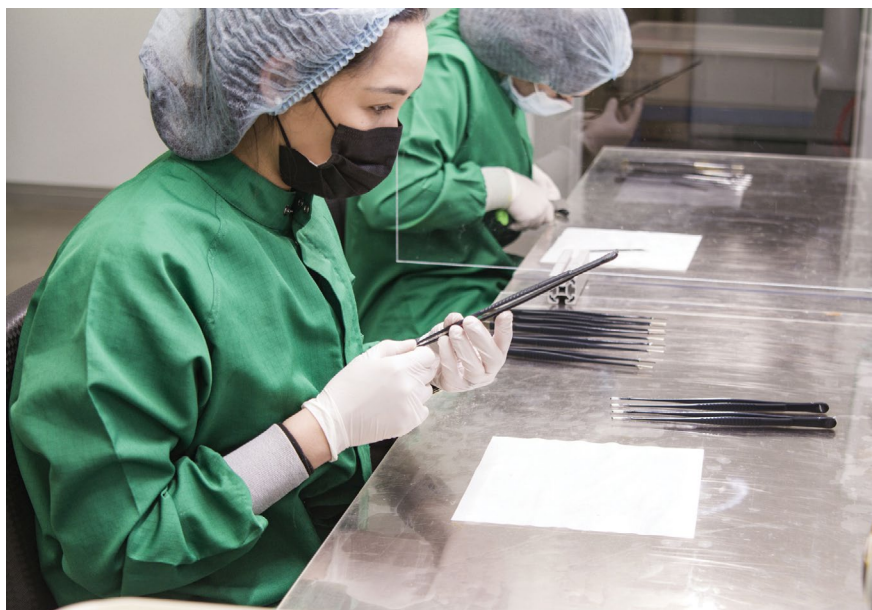
An die Beschichtung von OP-Pinzetten werden zahlreiche Anforderungen gestellt, die sich nur mit einer genau bemessenen Schichtdicke erfüllen lassen.

An die Beschichtung werden zahlreiche Anforderungen gestellt. Sie muss einerseits sehr dicht, hohlraumfrei und schmutzabweisend sein, um Verkeimungen zuverlässig zu verhindern. Andererseits ist aber auch Elastizität und exzellente Substrathaftung gefordert, damit keine Lacksplitter in die Operationswunde gelangen. Und nicht zuletzt muss die elektrische Isolationsfunktion über die gesamte Lebensdauer der Pinzette sicher gewährleistet bleiben. Das alles lässt sich nur mit einer genau bemessenen Schichtdicke erfüllen. Ist sie beispielsweise zu dünn, sind Haltbarkeit und elektrische Isolation nicht mehr gewährleistet. Ist die