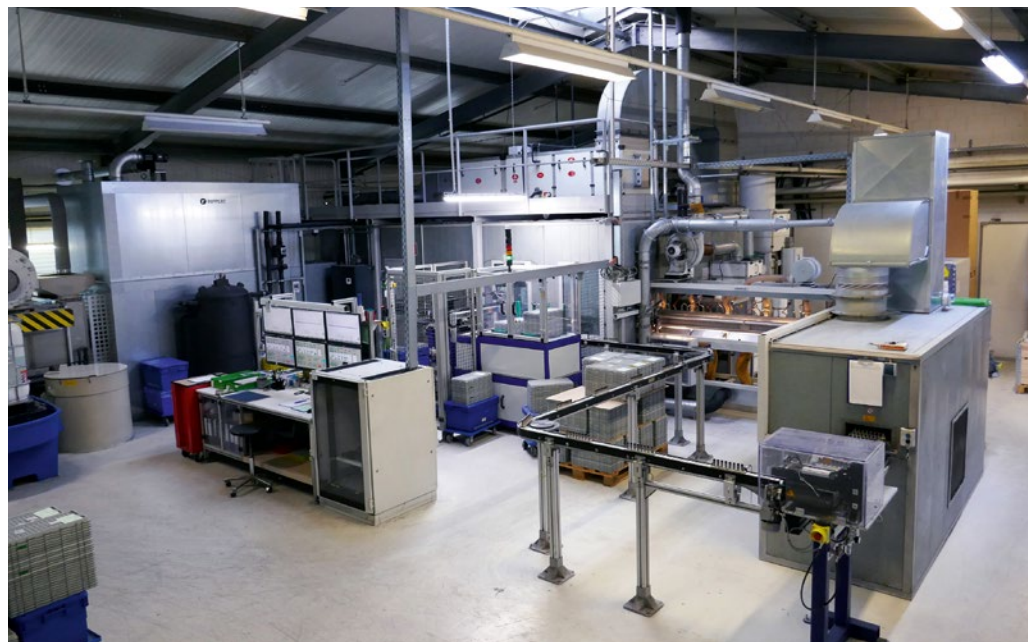
Damit die Qualität selbst bei anspruchsvollsten Pulverbeschichtungsaufträgen der Automobilindustrie stimmt, setzt die ILB bei sämtlichen Anlagen auf Schichtdickenprüfsysteme von OptiSense.